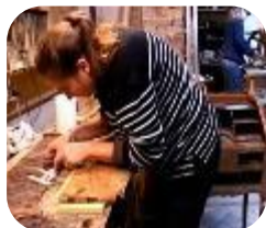
Métiers du bois