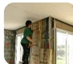
Isolation intérieure & extérieure